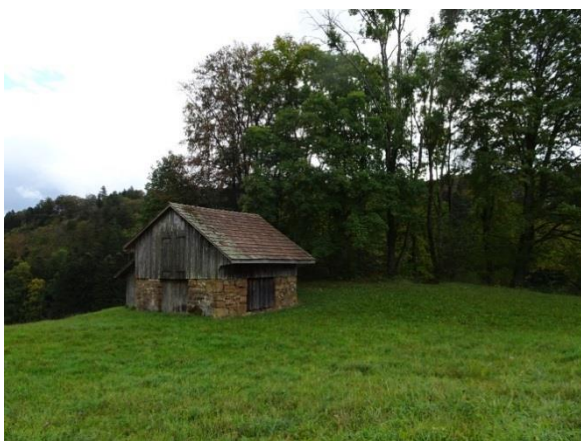
Feldscheune auf Bergmatten

Die meisten Feldscheunen entstanden um 1800, als die Bauern die Transporte zwischen den entfernten Feldern und dem Hof im Dorf mit Pferden oder Kühen ausführen mussten. Um diese zeitraubenden Transporte nicht in der strengen Zeit der Ernte durchführen zu müssen, wurden auf den entfernteren Feldern Heuschober